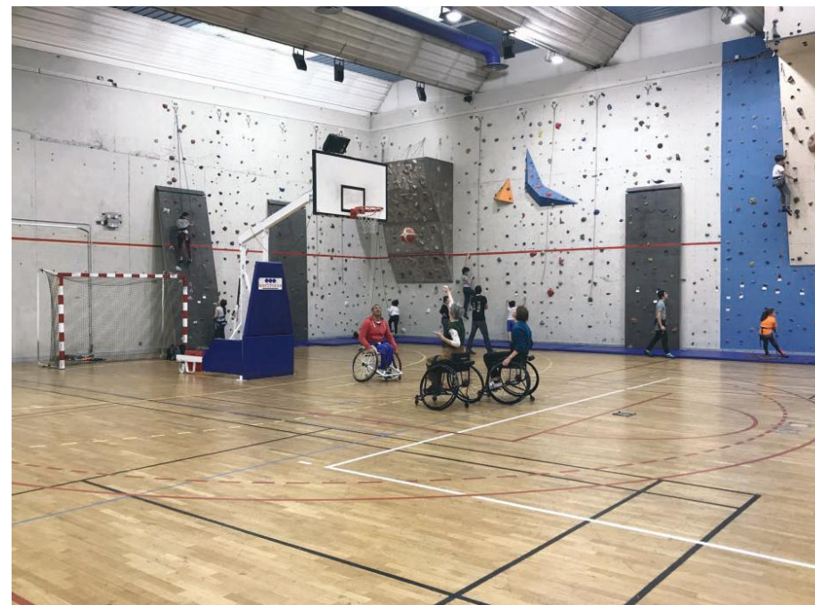
Introduction à la pratique du handibasket.