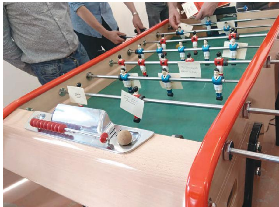
Choisir sont joueur sur le babyfoot fabriqué par l'entreprise Bonzini en 1927 à Bagnolet.