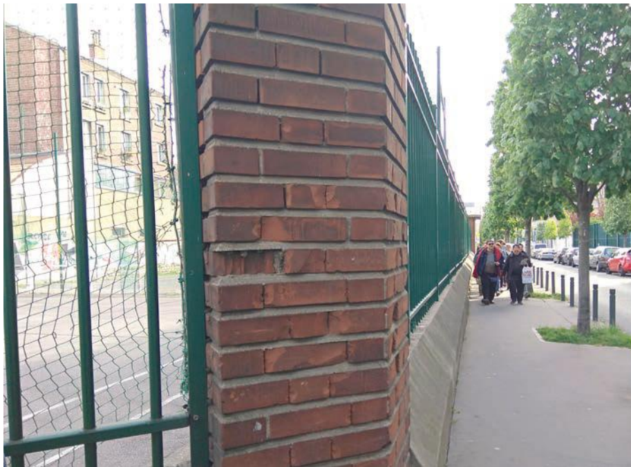
Marche jusqu'au Stade Bauer. Sur la route, entre la Galerie Mariton et le Stade, échanges de rôles art-sport.