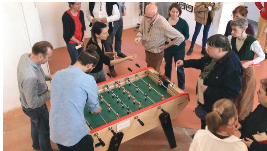
Organisation du match de babyfoot commenté.