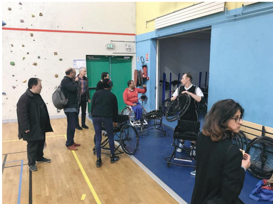
Préparation pour l'entrainement de handibasket avec l'équipe de St-Ouen Handibasket.