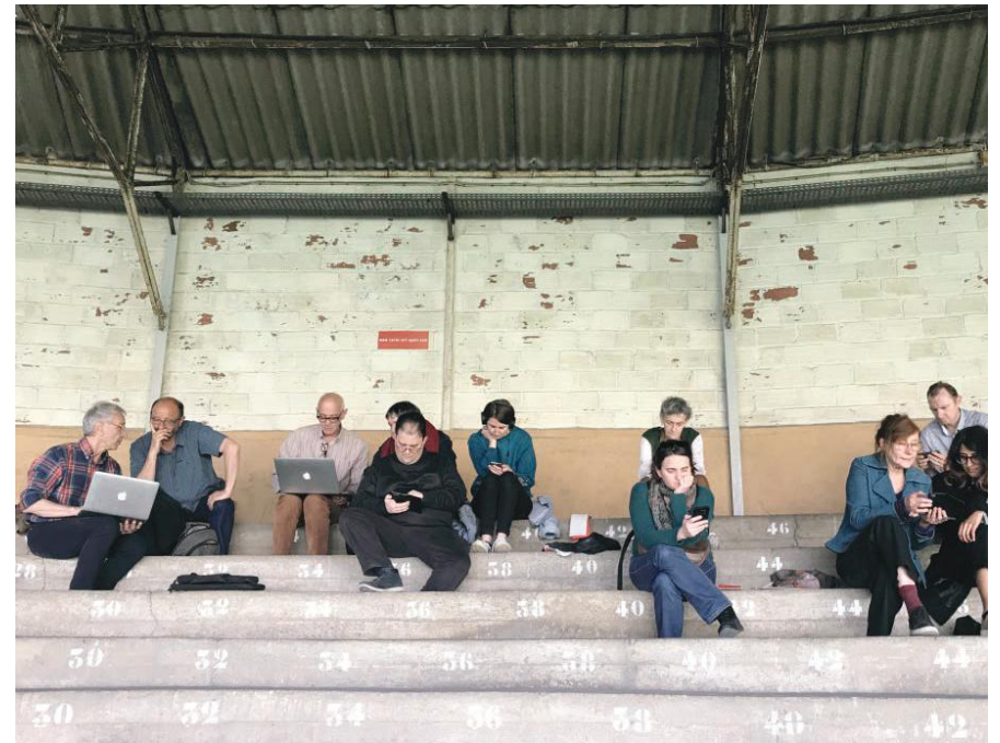
Travail sur la cartographie en ligne des projets arts sports dans les tribunes du Stade Bauer