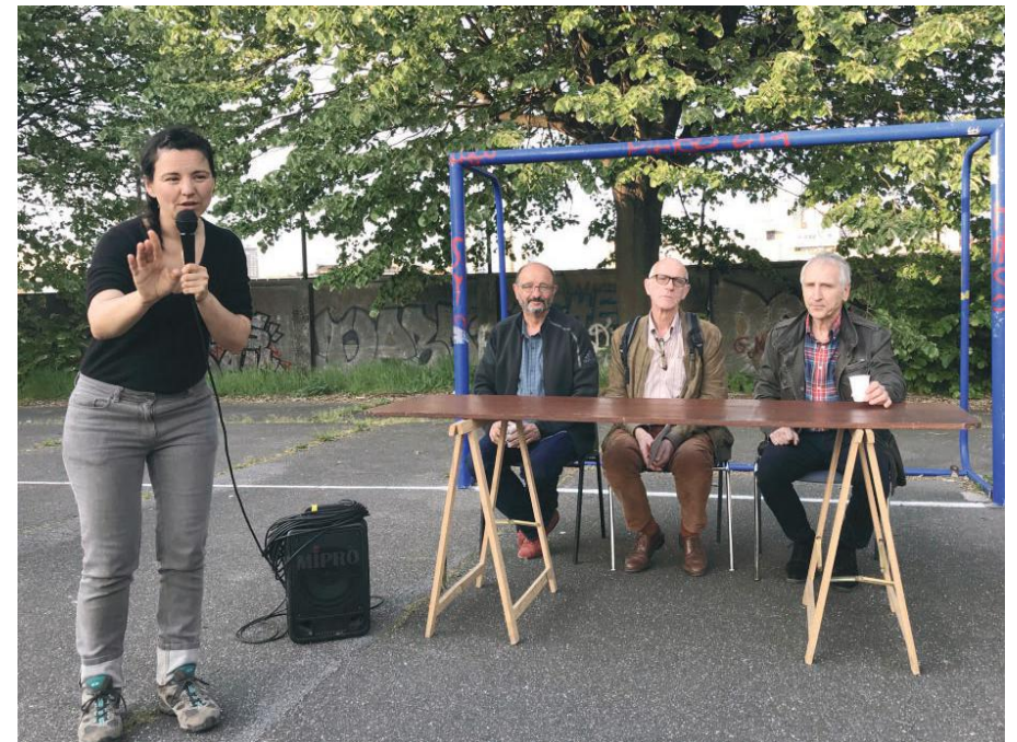
Bilan en forme de conférence tournante avec tout les participants de l'atelier sur le terrain de foot du Gymnase Joliot Curie.