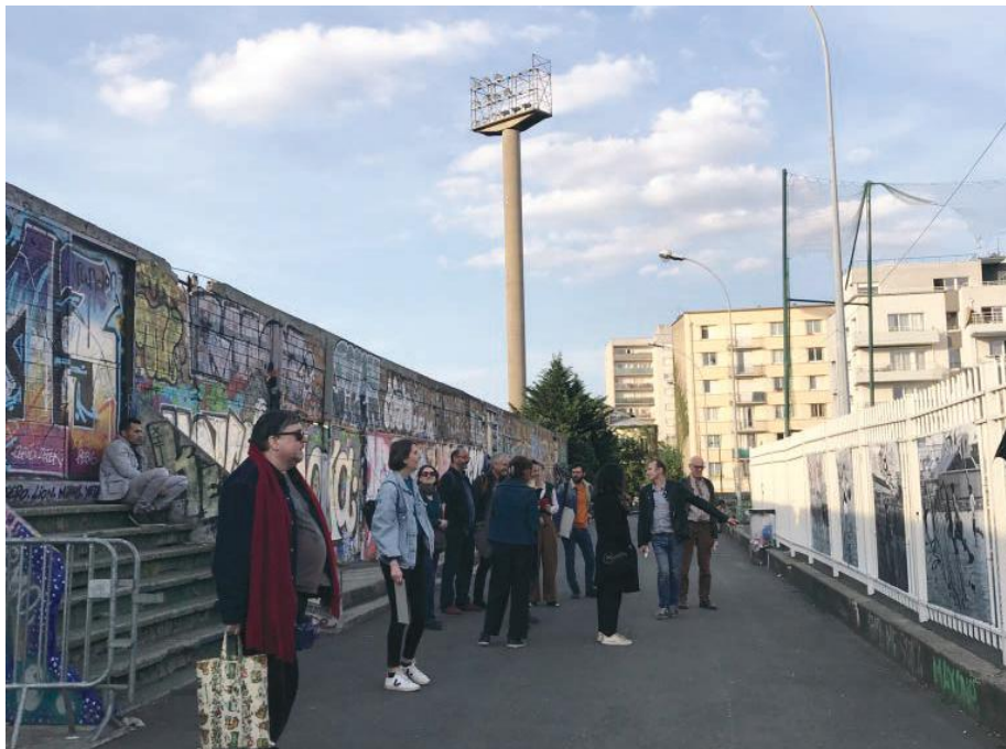
Marche jusqu'au Gymnase Joliot Curie en regardant l'exposition Passion Foot.